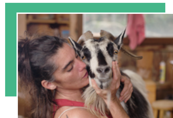
THÈMES : CHANGEMENT CLIMATIQUE • ACCÈS À LA TERRE • DROIT DES FEMMES • ALTERNATIVES, PROCESSUS DE A À Z • ÉCHANGES ENTRE VILLAGES • FORCE DU COLLECTIF