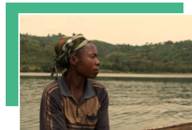
THÈMES : MODÈLE DE L'AGRICULTURE PAYSANNE • SOUVERAINETÉ ALIMENTAIRE • RÔLE DES FEMMES • RÔLE DES COOPÉRATIVES