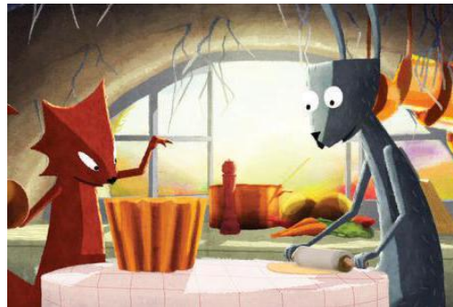
Table ronde et show d'impro d'auteurs et autrices de romans graphiques Un joyeux bordel qui mêle comédie

d'improvisation, musique live et dessin : c'est la promesse qui nous est faite ici. Ce show mélange trois disciplines dont les artistes devront se prêter au jeu de l'improvisation en direct et tenteront d'offrir des histoires amusantes et spontanées pendant 45 minutes. Le show sera précédé d'une table ronde où experts, dessinateurs et auteurs discuteront avec le public de la manière dont l'illustration peut influencer le futur de nos systèmes alimentaires.