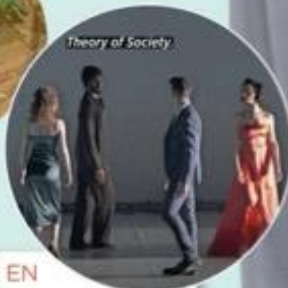
Theory of Society