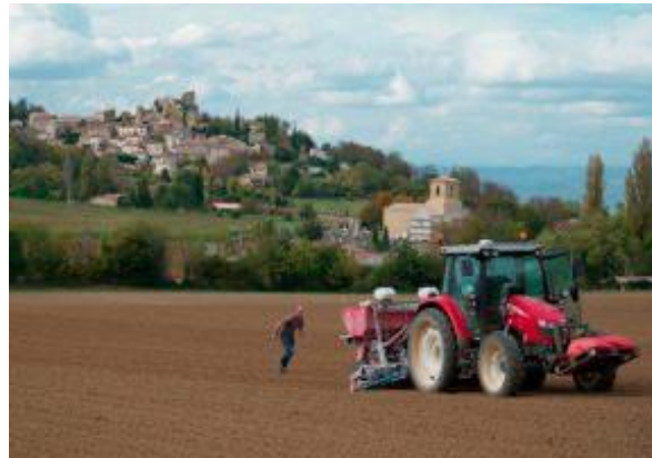
Le documentaire « La Théorie du Boxeur » sera diffusé à Bastogne et Arlon, dans le cadre du Festival « AlimenTerre ».

» À Bastogne, le 9 octobre à 19 h 30, au Champ Être (Tiers-Lieu nourricier). C'est gratuit. Et à Arlon, le 16 octobre, à 19 h, à la Maison de la Culture . PAF : 6 €.